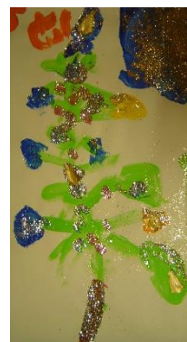
Fotoimpressie van werk uit groep 1-2B